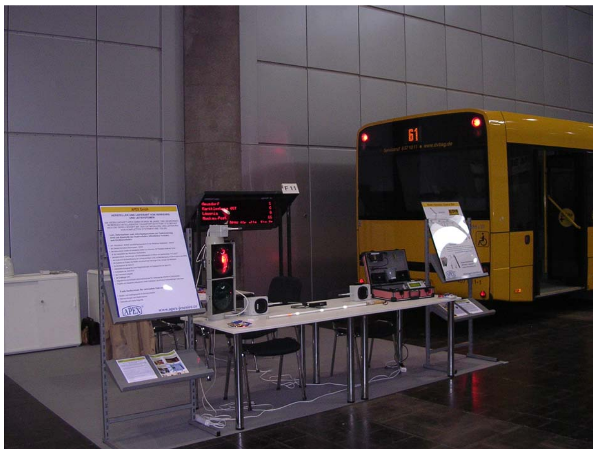
Stánek APEX s autobusem Dopravního podniku Drážďany

Ve stánku firmy APEX byl prezentován Elektronický orientační a informační systém pro nevidomé TYFLOSET. Byl předveden zvukový orientační maják pro budovy a podchody, zvukové zařízení pro semafor křižovatek a zastávkový informační systém pro informování cestujících. Součástí expozice firmy APEX byl autobus Dopravního podniku Drážďany vybavený zařízením TYFLOSET pro nevidomé. V loňském roce firma APEX totiž do Dopravního podniku Drážďany dodala pro celý vozový park 218 sad zařízení systému TYFLOSET.